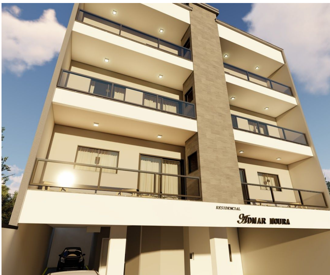
RESIDENCIAL ADMAR MOURA.

OPORTUNIDADE ÚNICA! PRÉ-LANÇAMENTO Centro de Camboriú! Apartamentos com 02 dormitórios. Entrega: Dezembro 2020..