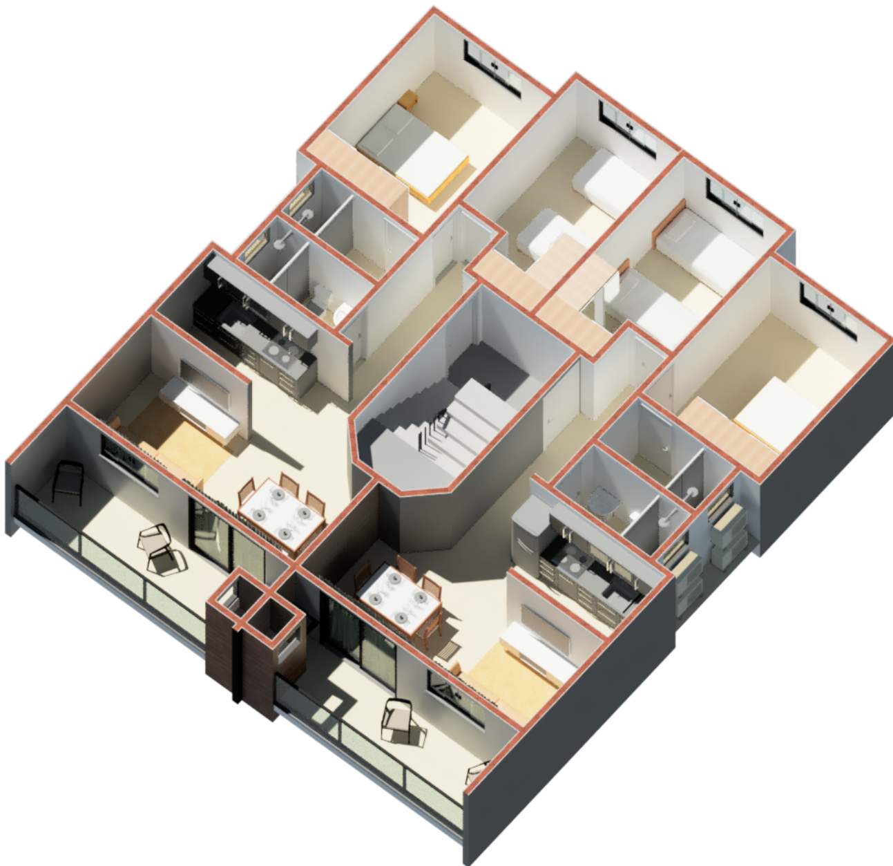
VISTA 3D APARTAMENTOS